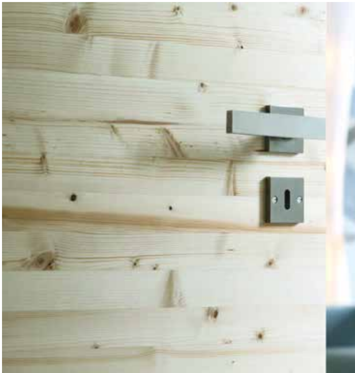
Wuchsmerkmale werden wieder bewusst in den Vordergrund gestellt.