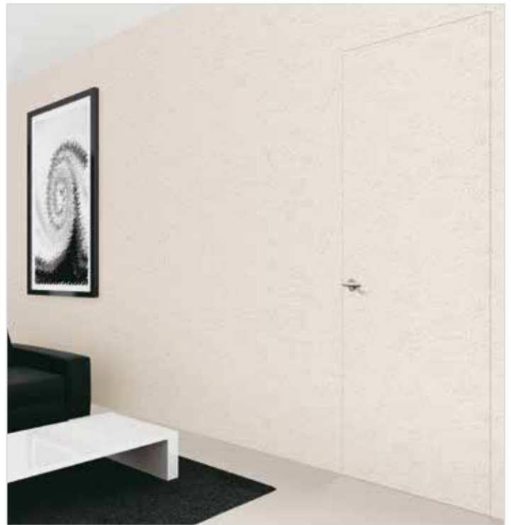
Türelemente, die mit der Wandfläche eins werden.